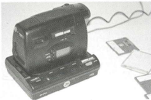
Yashica afslørede sin stillvideo prototype i dybeste hemmelighed bag lukkede døre – en særudgave af Samurai kameraet.

udgave. Chinon afslørede sin prototype i dybeste hemmelighed bag lukkede døre, og det samme gjaldt Yashica, der havde en stillvideo udgave af sit Samurai kamera. Fuji viste både analog og digital stillvideo, i professionel såvel som amatør-udgave.