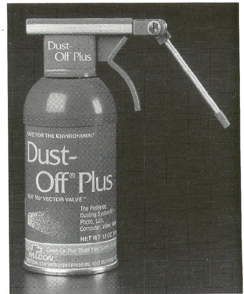
Dust-Off har udviklet et svingbart rør, så man lettere kan komme til at puste på vanskeligt tilgængelige steder.