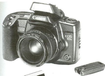
Canon EOS 10 har triple-AF og programmering med stregkode som på Panasonics videomaskiner.

Canon Prima Twin skabte interesse takket være 28 mm vidvinkel og Date-udgavens verdensur.